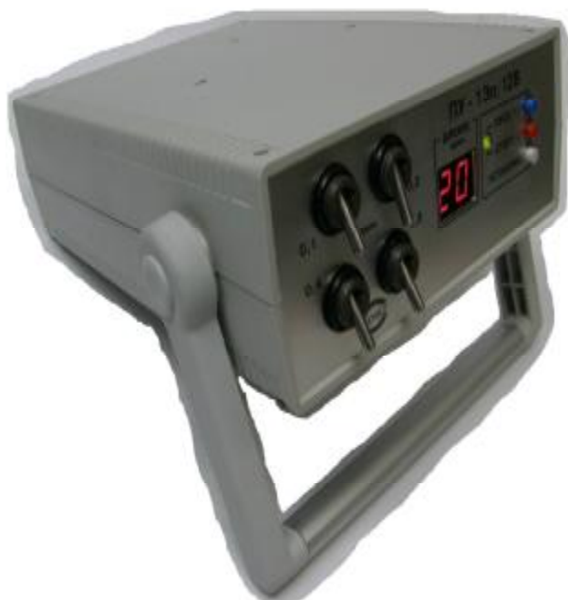
Рис. 1 Аспирант ПУ-1Эм, ПУ-1Эпм, ПУ-1Эпм исп.1

Фотографии общего вида аспирантов и схемы пломбировки от несанкционированного доступа с обозначением мест размещения наклеек: