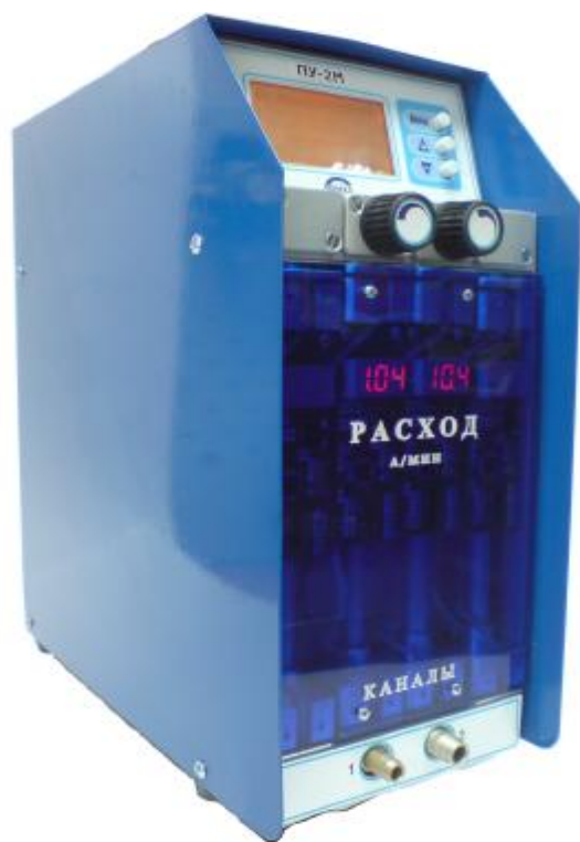
Рис. 5 Аспиратор ПУ-2М, ПУ-2М исп.1