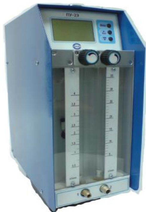
Рис. 3 Аспирант ПУ-2Э, ПУ-2Э исп.1