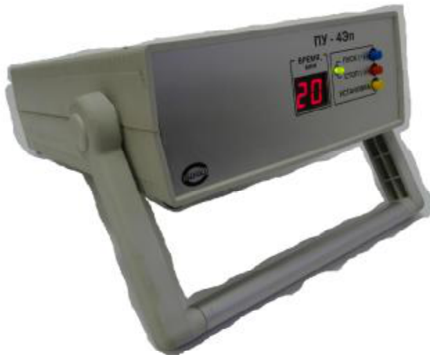
Рис. 13 Аспиратор ПУ-4Эп