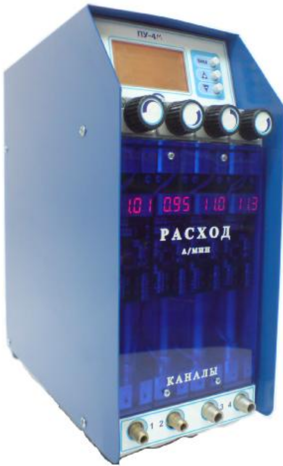
Рис. 11 Аспиратор ПУ-4М ПУ-4М исп.1