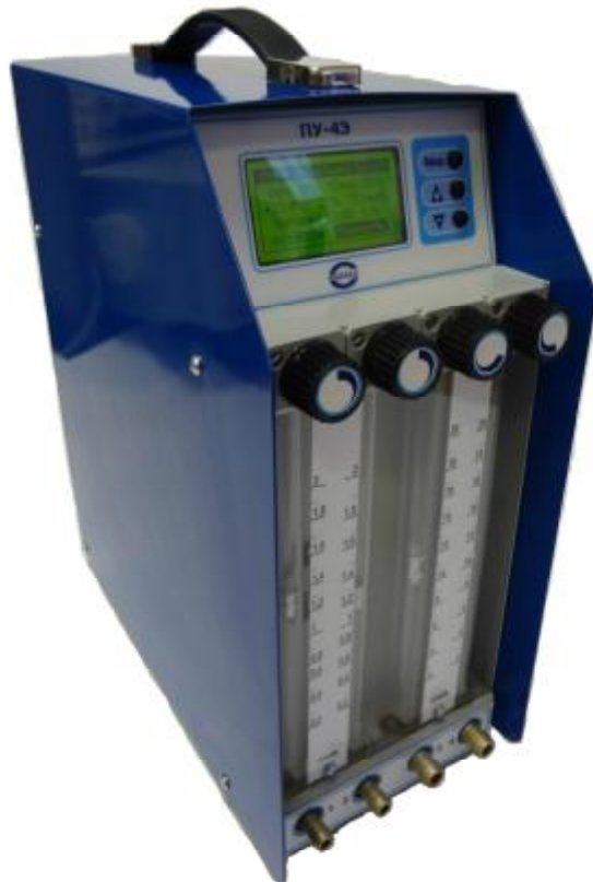
Рис. 9 Аспиратор ПУ-3Э («220»), ПУ-3Э исп.1 («12»)