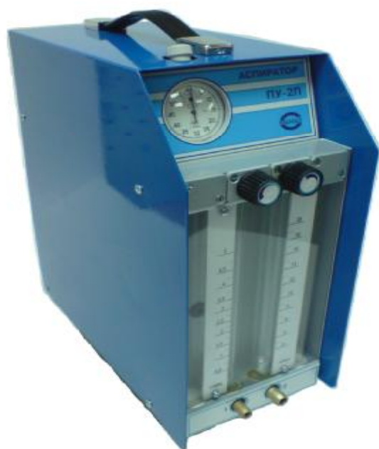
Рис. 7 Аспиратор ПУ-2П, ПУ-2П исп.1